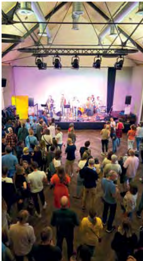
Die Band Soulecka sorgte in der Kulturscheune für gute Stimmung