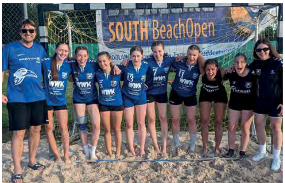
Die weibl. A-Jugend freut sich über den Turniersieg in Großlangheim.

Die A-Jugend spielte ein blitzsauberes Turnier und gewann alle ihre Spiele, gaben keinen Satz ab und besiegte dabei auch zwei Landesligateams. Mit guter Laune und zwei neuen Bällen kehrten beide Mannschaften zurück, um sich wieder auf die Vorbereitung zu konzentrieren.