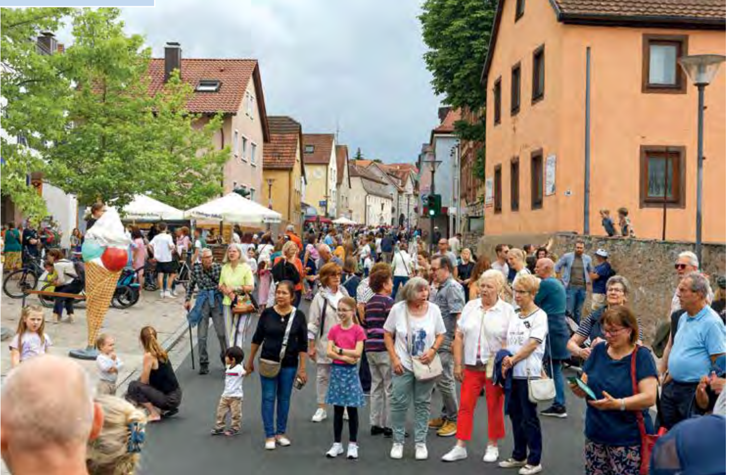
Bereits kurz nach Festbeginn war die Ortschaft gut gefüllt.

Immer aktuell informiert: www.hoechberg.de