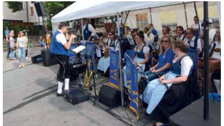
Erinnerungen an das Lindenfest 2019