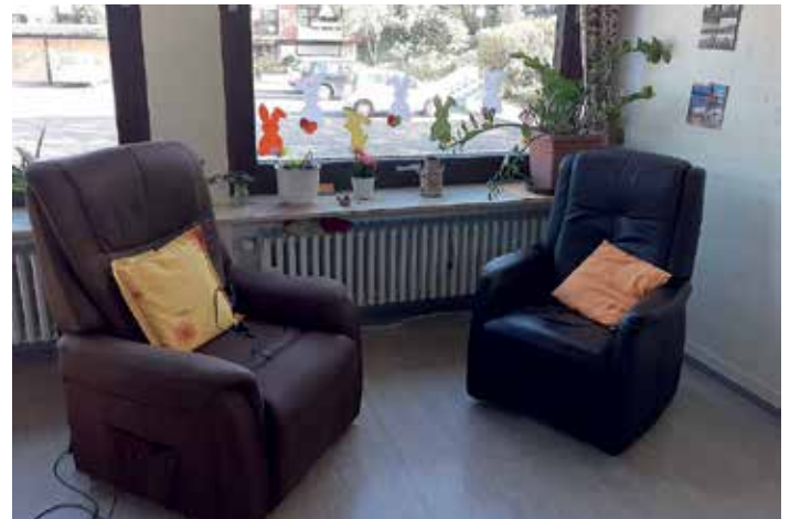
Deko-Osterhasen unter sich. Tagespflege-Gäste werden aktuell aus der Ferne betreut.

Bislang ist nicht klar, wann die Höchberger Tagespflege wieder öffnet. Günter Klopff zeigt sich jedenfalls beeindruckt von der Aktion. „Es imponiert mir, mit welcher Kreativität und Einsatzbereitschaft die Belegschaft dieser Herausforderung begegnet. So werden wir diese Zeit gemeinsam überstehen.“