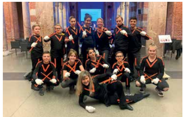
Auftritt für einige Höchberger Mittelschüler in der Münchner Residenz aus Anlass des Festaktes: 10 Jahre Mittelschule.