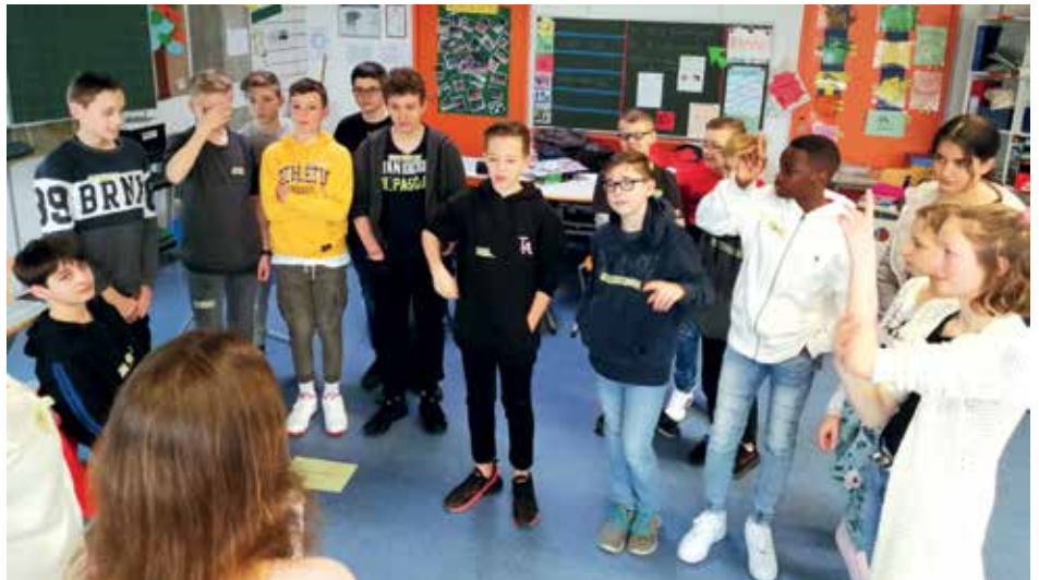
In einem Workshop lernten die Schülerinnen und Schüler der 7am der Mittelschule Höchberg Konfliktlösungsstrategien im Umgang mit Gewalt kennen.