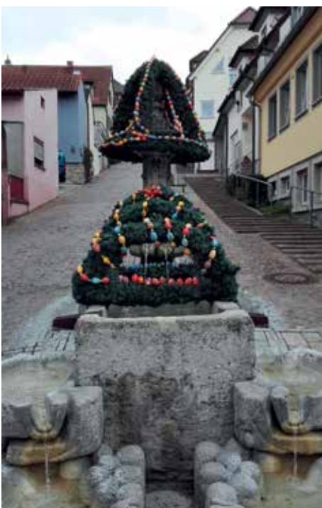
Der Osterbrunnen 2020 in der Brunnengasse.