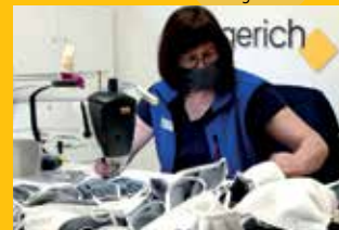
Wegerich fertigt Gesichtsmasken.

Wü-Heuchelhof: Huberstr. 1+2 | Wü-Lengfeld: Werner-von-Siemens-Str. 44 | Wü-Stadt: Hofstr. 3 (im Hause Schwarzweller) Tel. 0931-35979920 | Mo-Fr 9-18 Uhr · Sa 9-16 Uhr | besuchen Sie uns auch im Internet auf www.schaumstoffe-wegerich.de